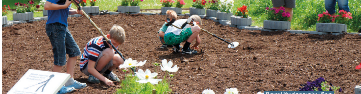
Stenvad Mosebrugcenter i Ørum