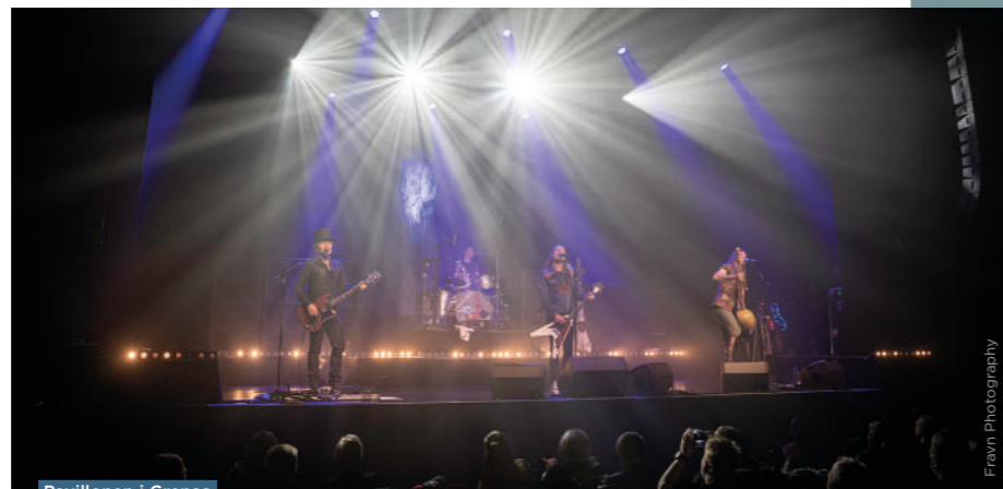
Pavillonen i Grenaa

En række intime scener i hjertet af Grenaa fyldes med korte koncerter á 20 minutter, lige til at stoppe op ved når man går rundt i byen. Alle musikere vurderes af professionelle dommere inden for musikbranchen, som uddeler præmier til de bedste. Festivalen afsluttes om aftenen med et kendt hovednavn.