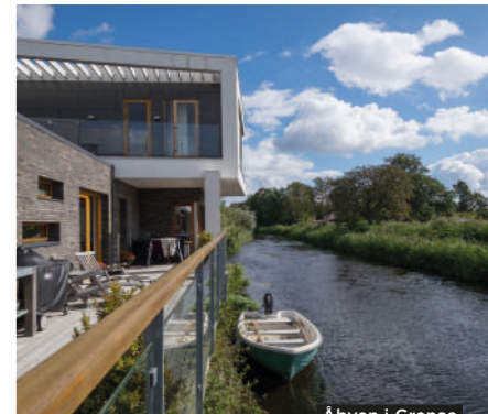
Åbyen i Grenaa