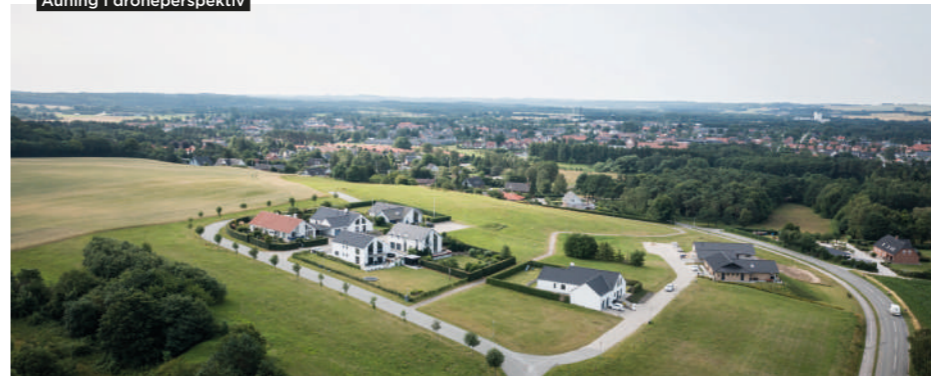
Auning i droneperspektiv