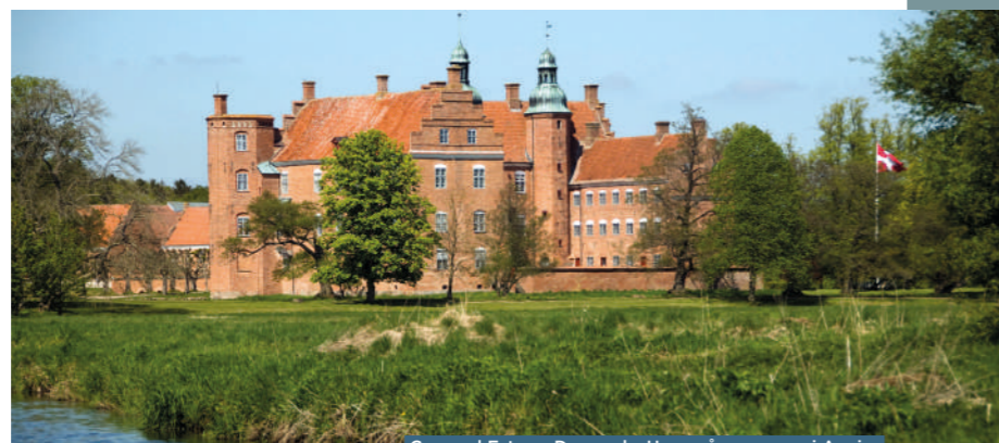
Gammel Estrup, Danmarks Herregårdsmuseum i Auning