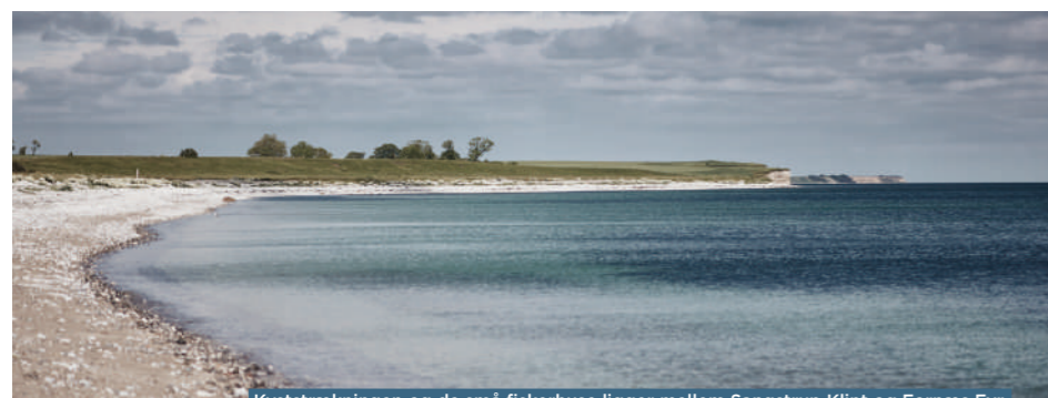
Kyststrækningen og de små fiskerhuse ligger mellem Sangstrup Klint og Fornæs Fyr.

Jeg husker engang, hvor vandet var fuldstændig blikstille, og jeg fik øje på et marsvin under vandet. Som kontrast til vand og himmel, kunne jeg se helt ned til den hvide kalkbund, hvor marsvinet svømmede rundt. Der tænkte jeg wow!